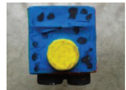
Varias vistas de nuestro muñequito o personaje